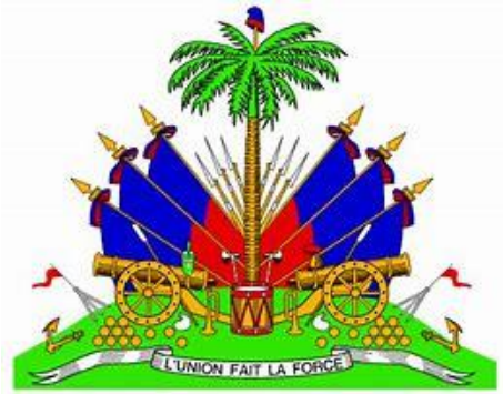
República de Haití